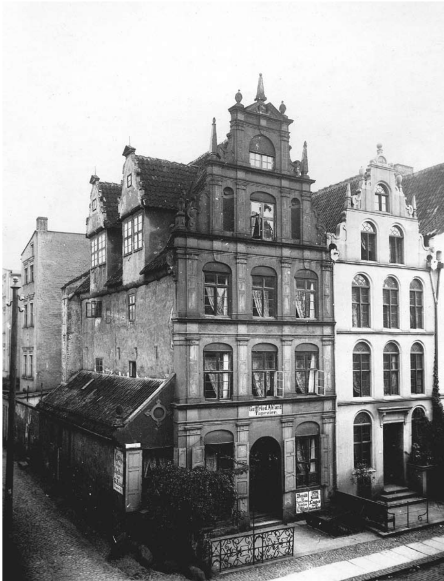
Il. 1. Kamienica cechu kramarzy w Elblągu, fot. z początku XX w., Muzeum Historyczno-Archeologicznego w Elblągu