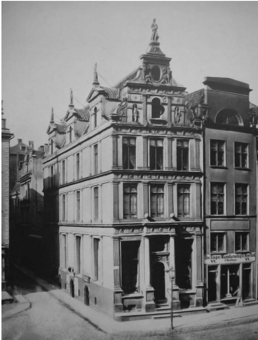
Il. 3. Kamienica Connertów przy ul. Długiej 45 w Gdańsku, wg K. Hauke, Das Bürgerhaus in Ost- und Westpreussen... , il. 58