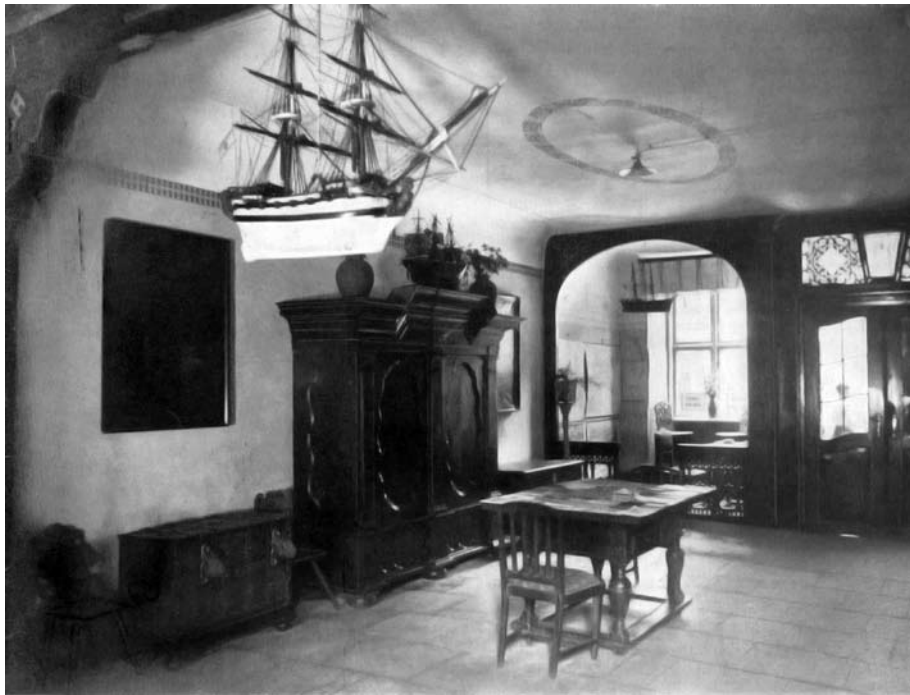
Il. 5. Widok wnętrza sieni kamienicy cechu kramarzy w Elblągu, wg Elbing, bearb. v. T. Lockemann, Berlin 1926